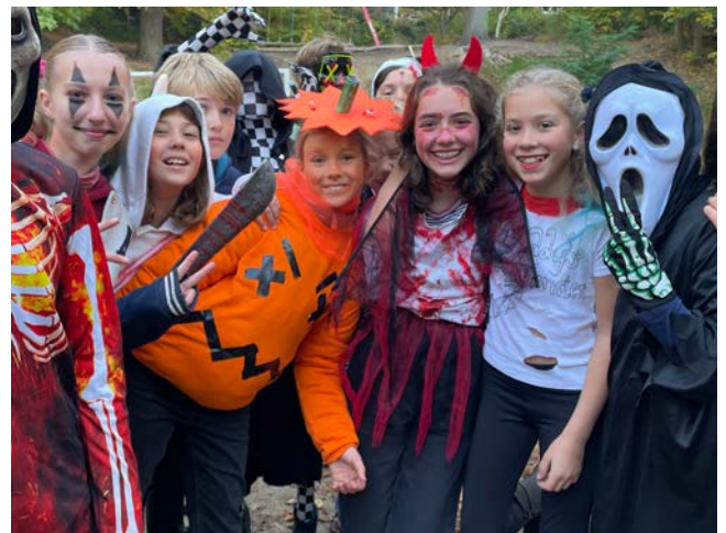
Unsere Sechstklässler beim diesjährigen Halloweenfest am Kahlkamp. Unsere Schülerinnen und Schüler der 6. Klassen und der anderen Stufen sowie unsere Eltern werden euch und Sie am Tag der offenen Tür durch die Schule führen. Sie freuen sich schon sehr darauf!

* Wir bitten um Anmeldung über unsere Homepage unter dieser Adresse: